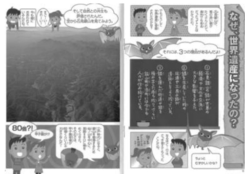
写真1 大田市教育委員会石見銀山課発行のパンフレット