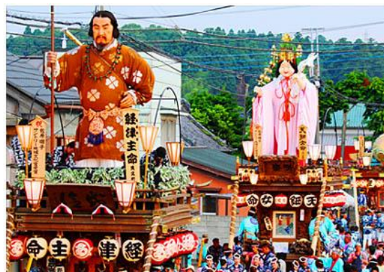
図 1 佐原大祭り「山車祭り」 8

千葉県北東部、利根川下流の水郷低地に位置する佐原地区は、江戸時代の河港商業都市として発展した。関東三大山車祭りの一つ「山車祭り」が脈々と続けられており、住民に強い地縁意識が形成された。1988年に竹下登内閣は「ふるさと創生事業資金」を推進したきっかけに、当時の佐原市全体から選ばれた若い市民代表者が集まり、市役所の検討も加えてこの創生事業資金の利用について当時の「まちづくりを語り合う場」で話し合った。話合われた結果、町を保存することになったことと住民組織を成立することになった。1991年1月に22名の住民代表者による「佐原の町並みを考える会」(以下考える会)が発足した。地縁型の性格をもっていると考えられる。