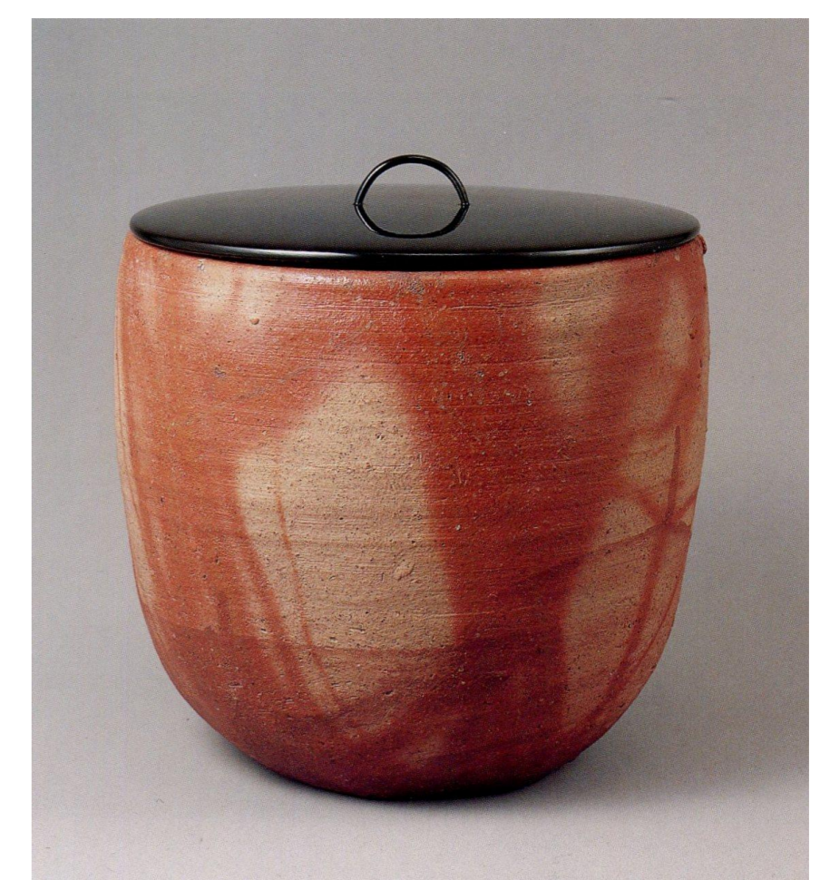
備前緋襷水指 桃山時代・16世紀 室町三井家旧蔵 三井文庫所蔵

以下に、これまでおこなってきた調査の中から、麦積山石窟と雲岡石窟を取り上げ紹介します。