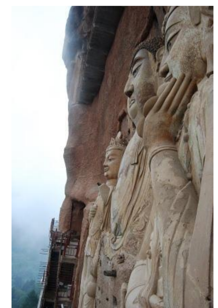
隋時代の摩崖大仏