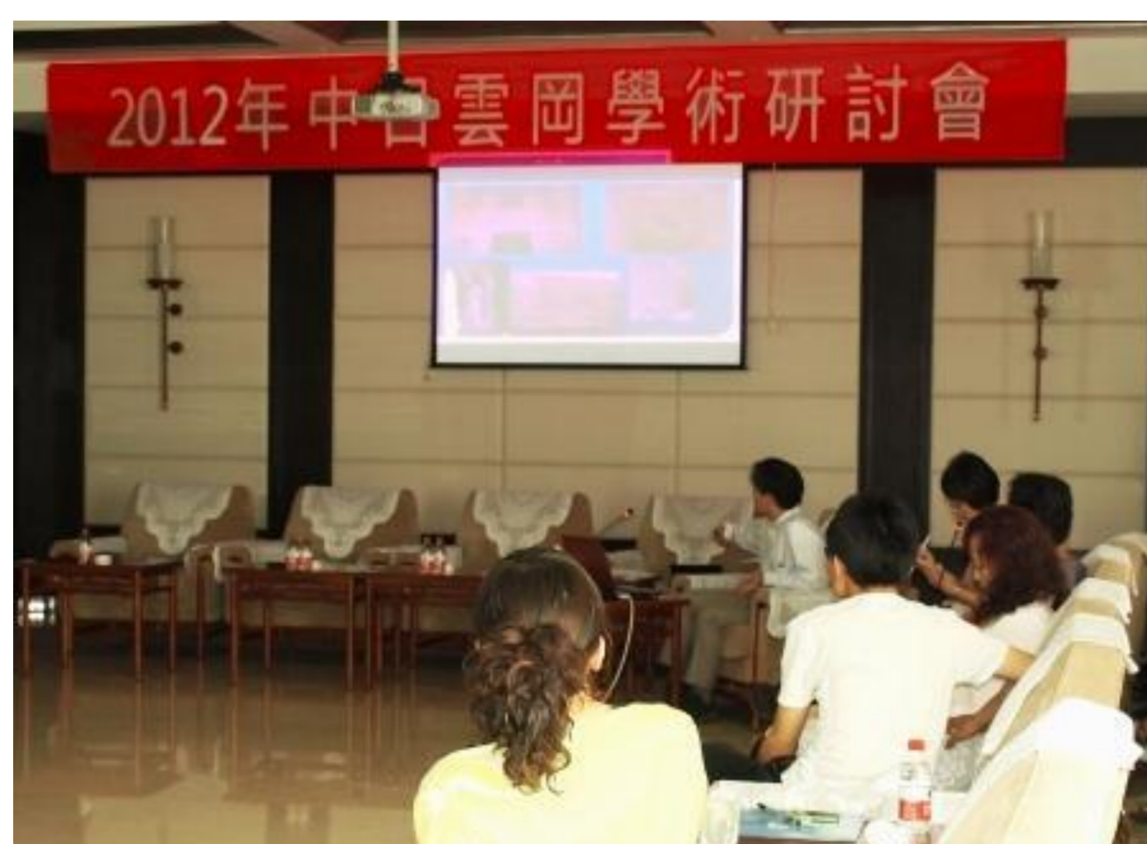
2012年中日雲岡學術研討會の様子

当研究室では2011年より年に一度雲岡石窟研究院と研究会を開き、相互の研究発展のため交流を進めている。2014年まで年に1度雲岡石窟研究院において研究会が開催され、学生も発表をおこなった。