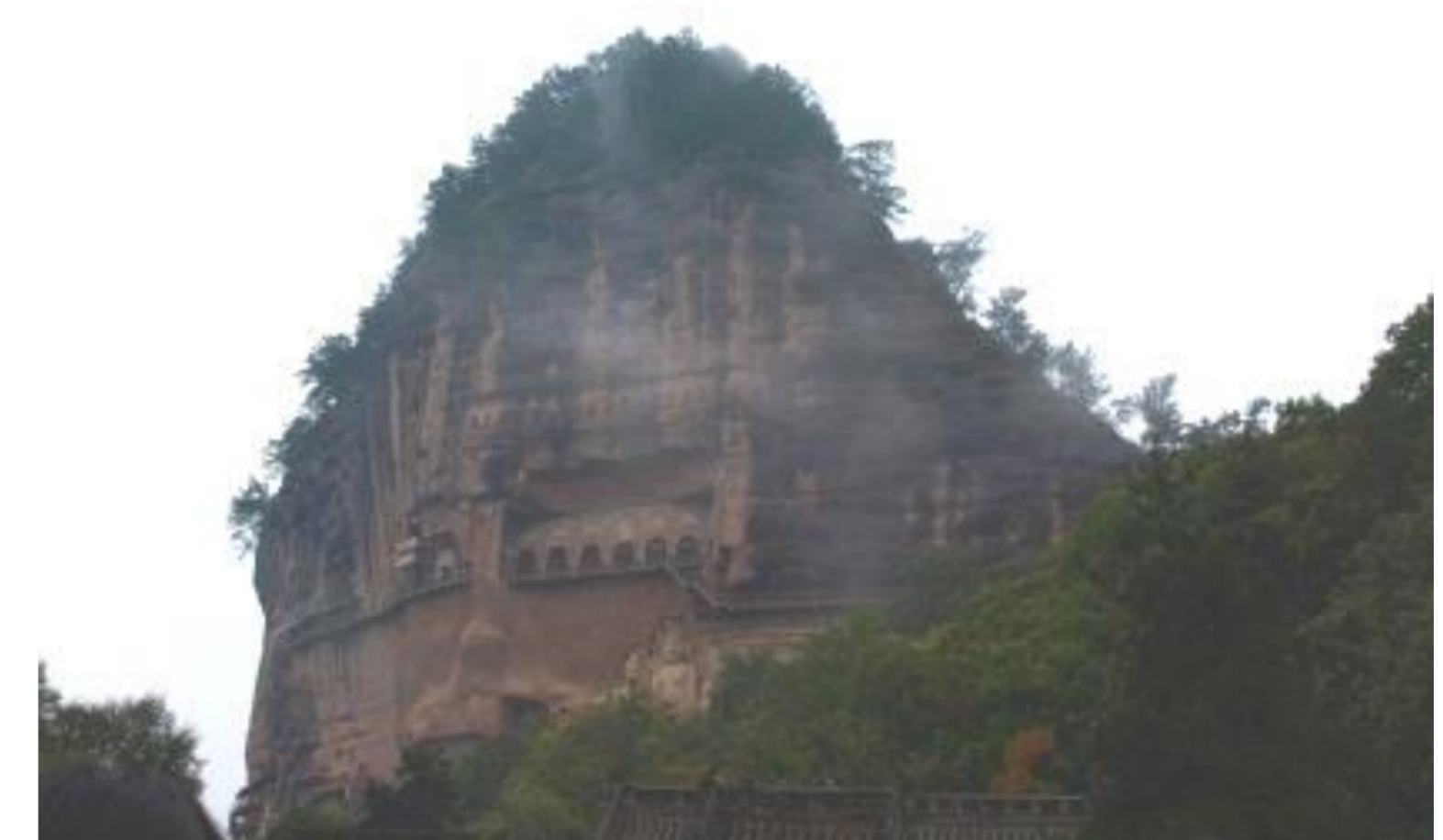
霧雨の中の麦積山石窟